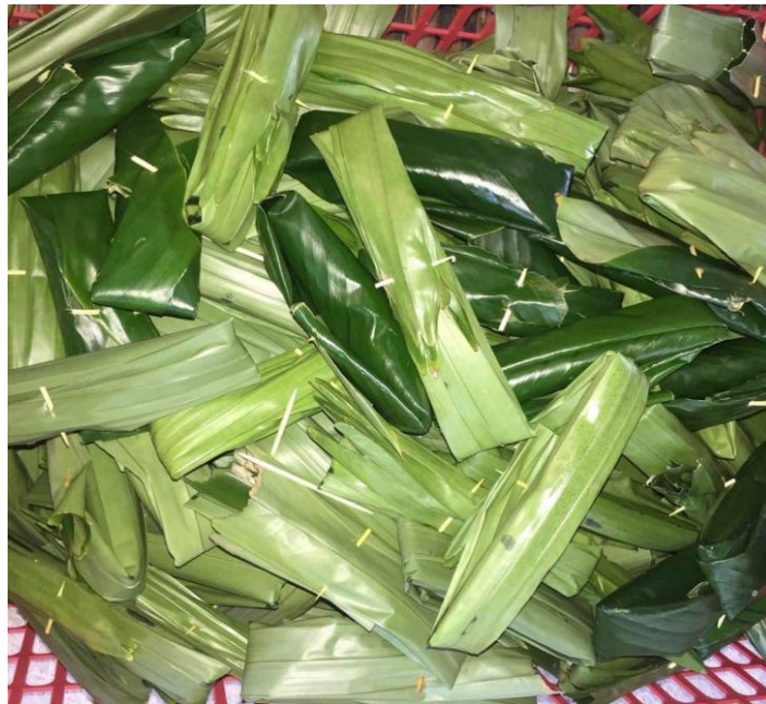
Rajah 1.5: Kelupis Siap Dibungkus