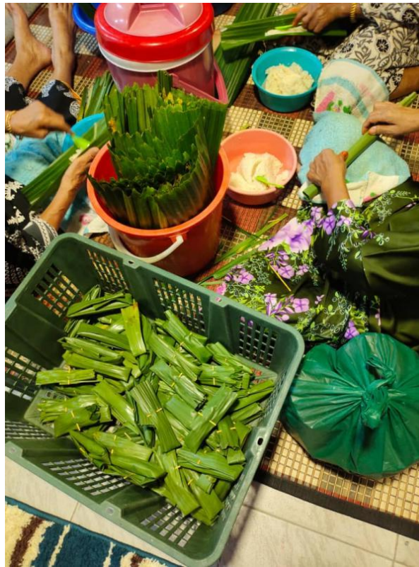
Rajah 1.3: Proses Membuat Kelupis