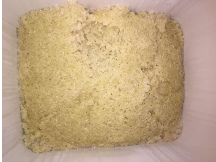
Rajah 1.2: Beras Pulut Yang Siap Dimasak