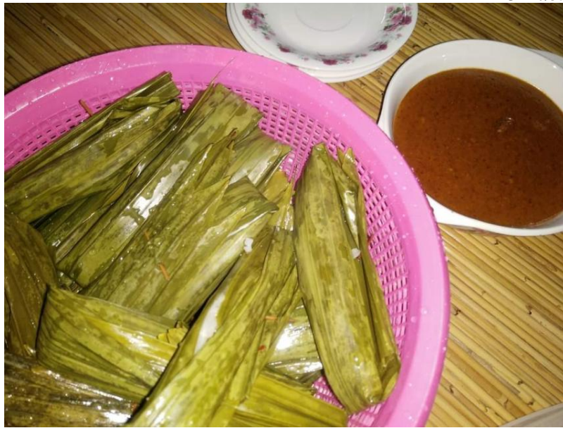
Rajah 1.4: Kelupis Dihidangkan Bersama Kuah Kacang