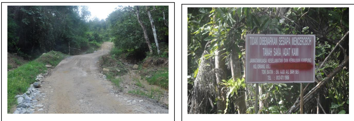
Gambar 1: Keadaan Jalan dan Papan Tanda Kg. Orang Asli Sg. Perangin

Chenain, Kampung Sungai Perangin, Kampung Sungai Bil dan Kampung Sungai Lembing. Boleh dikatakan perkampungan Orang Asli berada berdekatan dengan kampong Melayu dan berdekatan juga dengan pekan-pekan kecil seperti pekan Tanjung Malim dan pekan Slim River. Masyarakat Orang Asli mempunyai tahap interaksi yang tinggi dengan masyarakat Melayu. Kecuali perkampungan Orang Asli yang berada jauh ke pedalaman seperti Pos Tenau, Pos Tibang, Pos Keding dan Pos Gesau yang berada jauh ke dalam Hutan Bukit Slim. Sementara Kampung Orang Asli Sungai Perangin pula mengalami kesukaran dari segi perhubungan disebabkan masih bergantung kepada jalan yang masih belum berturap sepanjang satu kilometer. Keadaan jalan adalah sebagaimana gambar 1 di bawah.