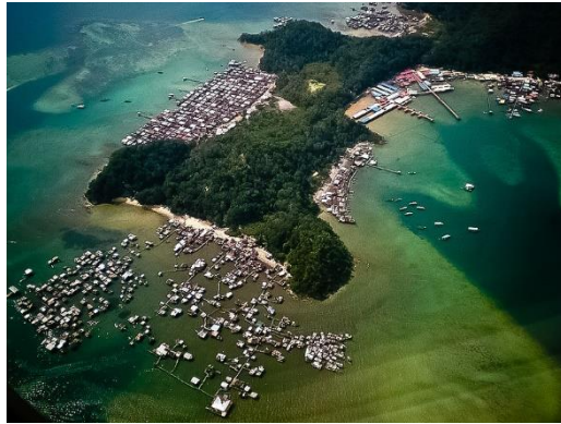
Rajah 2.0 : Penempatan bangsa Moro di Pulau Gaya